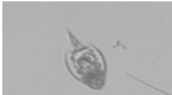
Gambar 2. Argulus sp.

Ukuran Argulus sp. yang didapatkan pada penelitian ini memiliki panjang 0,3 cm. Jasminandar 2011 menemukan argulus yang menyerang pada ikan nila merah berukuran panjang 0,2-0,5 cm menginfeksi ikan pada bagian kulit atau sirip.