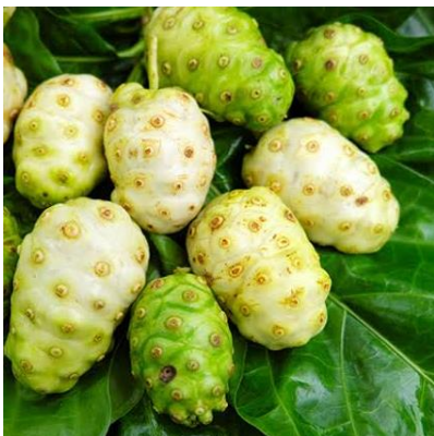
MENKUDU Morinda citrifolia