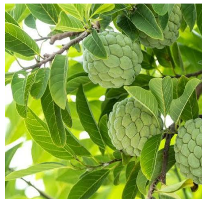
SRIKAYA Annona squamosa