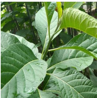
Sambung Nyawa Vernonia amygdalina