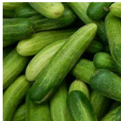
TIMUN Cucumis sativus