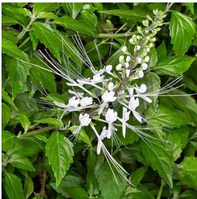
KUMIS KUCING Orthosiphon aristatus