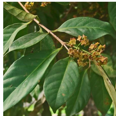
SALAM Syzygium polyanthum