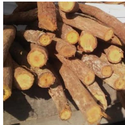
BAJAKA Spatholobus littoralis