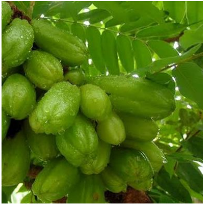
BELIMBING WULUH Averrhoa blimbi