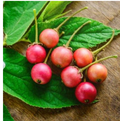
GERSEN Muntingia calabura