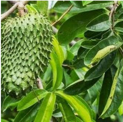
SIRSAK Anona muricata