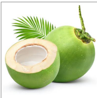
KELAPA Cocos nucifera L