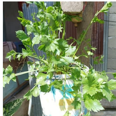
SELEDRI Apium graveolens