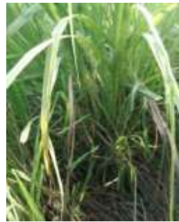
Serai ( Cymbopogon citratus L.)