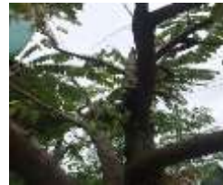
Belimbing ( Averrhoa carambola )