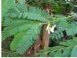
Turi ( Abris precatorius L.)