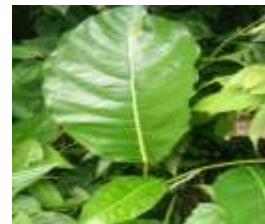
Awar-awar ( Ficus septica Burm F.)