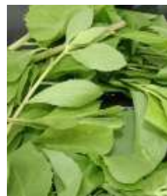
Beluntas ( Pluchea indica )