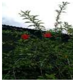
Kembang sepatu ( Hibiscus rosa-sinesis L.)