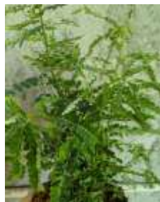
Meniran ( Phyllanthus niruri L.)