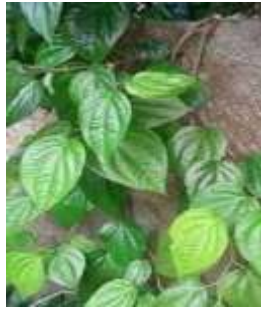
Sirih ( Piper betle L.)