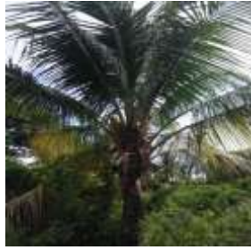
Kelapa ( Cocos nucifera L.)