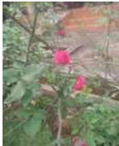
Mawar ( Rose )