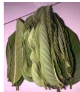
Daun jambu biji ( Psidium guajava L.)