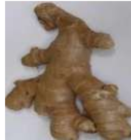
Jahe ( Zingiber officinale )