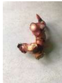
Lengkuas ( Alpinia galangal )