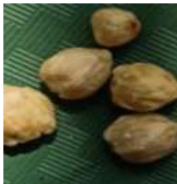
Kemiri ( Aleurites moluccanus )