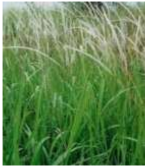
Alang-alang ( Imperata cylindrica L.)