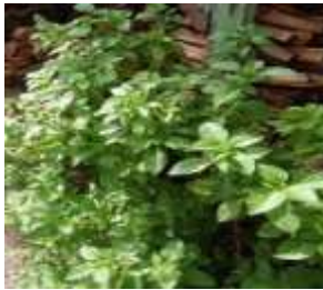
Kemangi ( Ocimum sanctum L.)