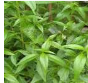
Sambiloto ( Androgaphis paniculata )