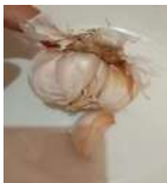
Bawang Putih ( Allium sativum L.)