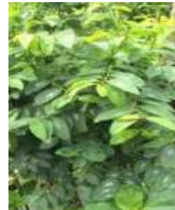
Katuk ( Sauropus androgynous L.)