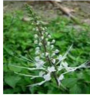
Kumis Kucing ( Orthosiphon aristatus L.)